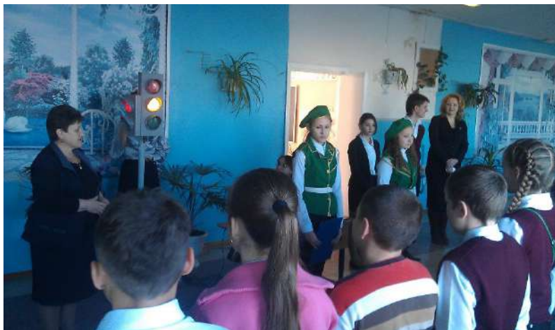
Линейка, посвящённая началу олимпиад